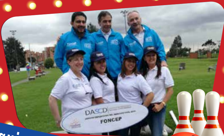
Equipo de bolos