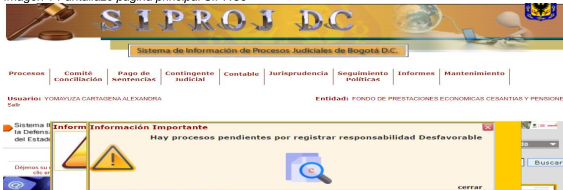
Imagen 1 Pantallazo página principal SIPROJ