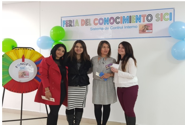
Fotografía tomada en la premiación