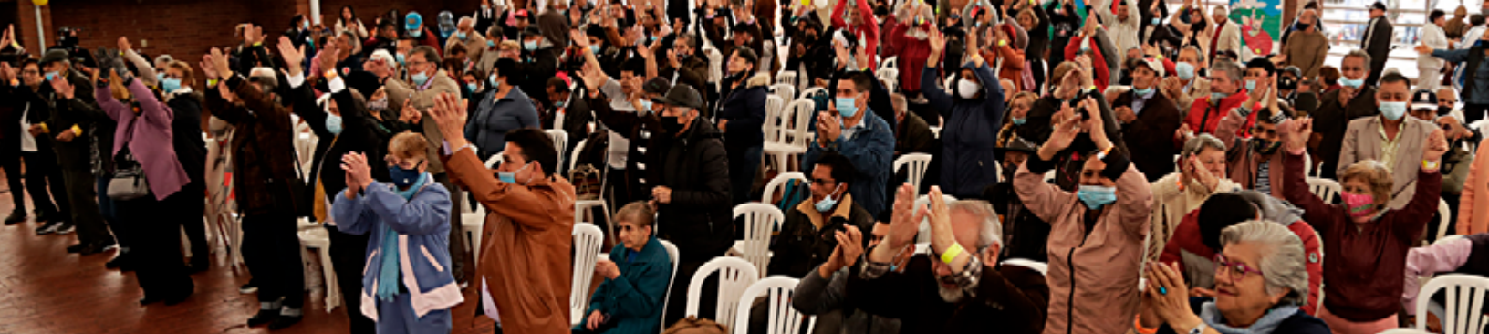
Celebración del Día Nacional de las Personas de la Tercera Edad y del Pensionado 2022 en la Plaza de los Artesanos en Bogotá.