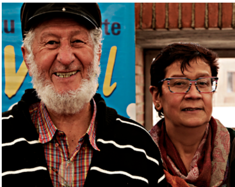
Nuestras y nuestros pensionados felices en la celebración.

Transmilenio S.A. se unió con un punto de personalización móvil de la tarjeta Tu Llave adulto mayor, para acceder a descuentos en el Sistema Integral de Transporte de Bogotá. FONCEP contó con una oficina móvil para facilitar procesos y trámites de forma segura y confiable durante la jornada.