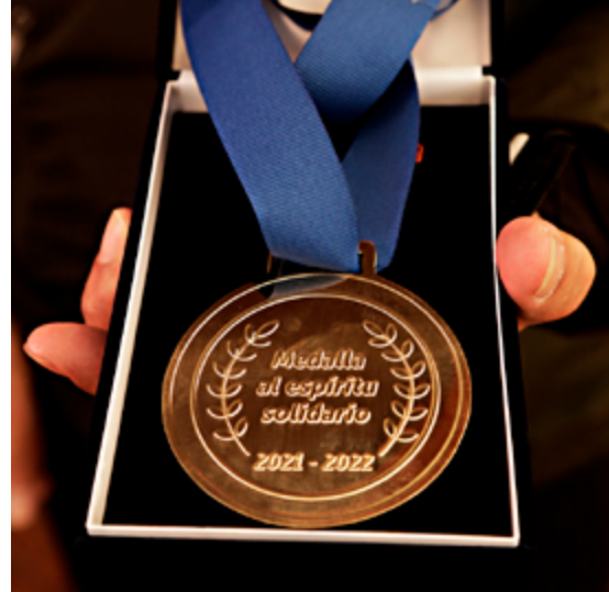
Fotos de la medalla y los ganadores tomadas por Alberto Jiménez para comunicaciones FONCEP.

Para FONCEP es un honor dedicar este espacio a nuestros homenajeados: