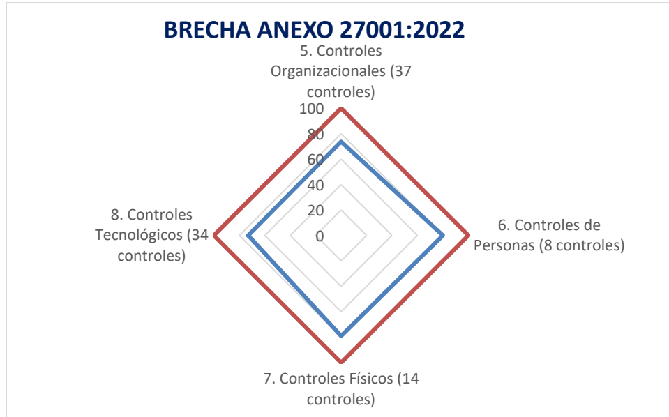
Ilustración 4 Brechas Anexo 27001:2022

A partir de la evaluación de la calificación de MSPI (2023 - 2024), se identifica un aumento en la calificación con respecto al periodo previo (de 68 a 74), esto debido al alza en la calificación de la efectividad de múltiples controles, los cuales repercuten en la clasificación global.