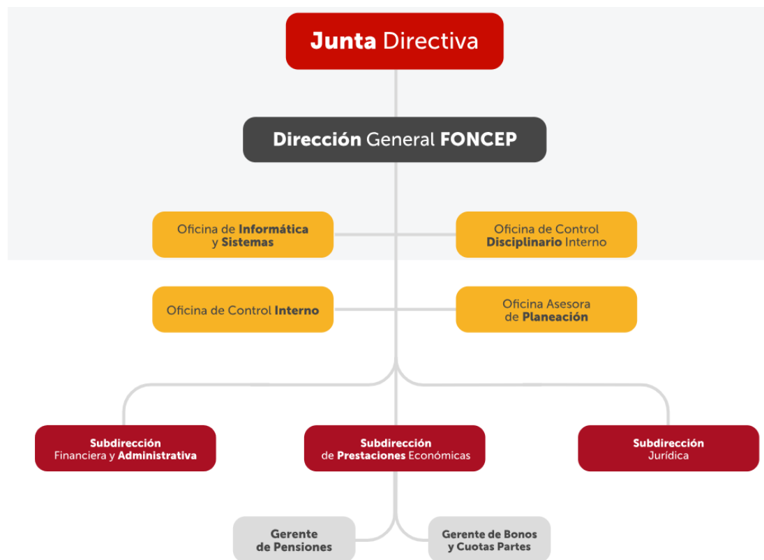
Ilustración 6 Ilustración 5 Organigrama FONCEP.

El Organigrama de FONCEP establece la ubicación de la Oficina de Informática y Sistemas, responsable de la seguridad de la información, como se muestra a continuación: