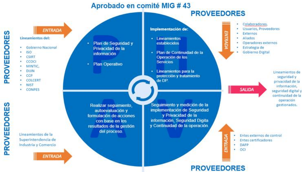
Ciclo PHVA del proceso de Seguridad y Privacidad

Ilustración 2 Metodología PHVA Fuente: MinTIC