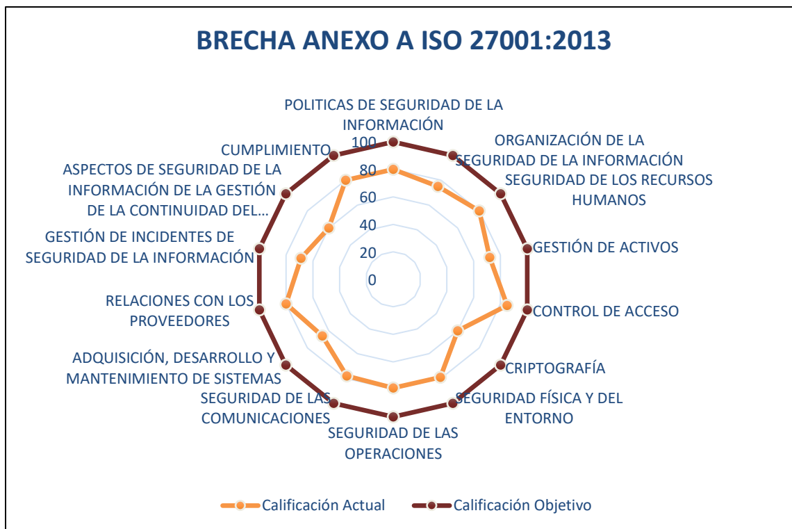
Ilustración 3 Brechas de Seguridad.