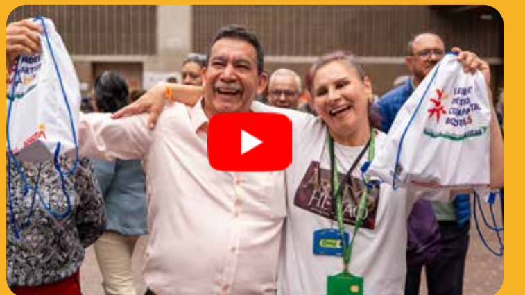
Mira aquí el video del evento de FONCEP se toma tu localidad: Kennedy